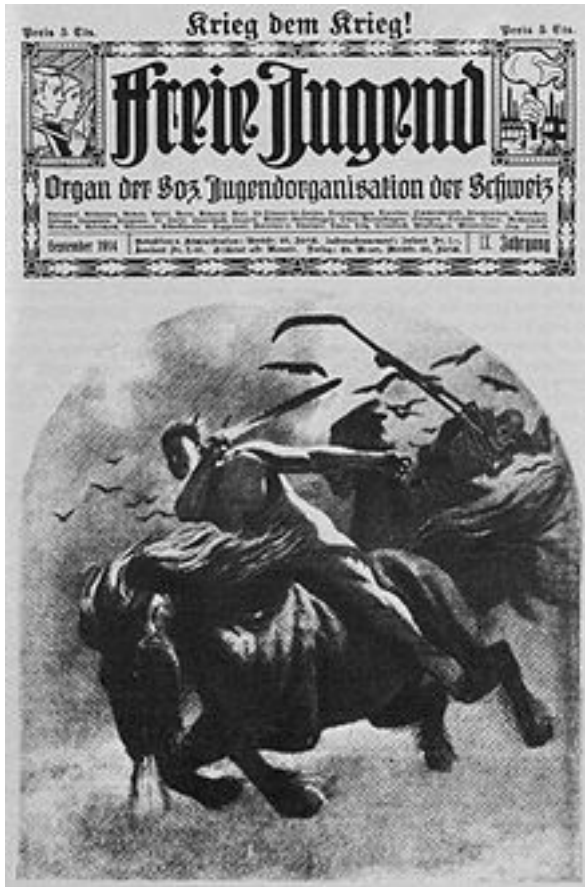
Titelblatt der von Münzenberg redigierten jungsozialistischen Zeitschrift Die Freie Jugend vom September 1914

Willi Münzenberg (Wilhelm Münzenberg [1] ; * 14. August 1889 in Erfurt ; † Juni 1940 in Saint-Marcellin, Département Isère, Frankreich ) war ein deutscher Kommunist , Verleger und Filmproduzent . Mit dem Neuen Deutschen Verlag , seinen Zeitungen Welt am Abend , Berlin am Morgen und vor allem der Arbeiter Illustrierten Zeitung (AIZ) gehörte Münzenberg zu den einflussreichsten Vertretern der KPD der Weimarer Republik . Bedeutend ist vor allem sein Einsatz gegen den Kolonialismus der europäischen Mächte. Nach 1937 wandte er sich von der offiziellen Parteilinie ab und wurde aus der Partei ausgeschlossen.