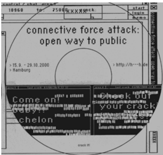
Knowbotic Research, xxxxxx connective force attack - open way to public, Hamburg 2000. Grafische Gestaltung, Typografie und lay-out/ Recto des Booklets/ CD-Rom-Faltblatts.

inmitten der anfänglichen Reize einsetzenden Verrechnungsprozessen entwickelt (vgl. Breidbach 2000). Die apparativ gestützte Extension leiblicher Funktionen entspricht dem. Man kann also das Techno-Imaginäre auch als eine ästhetische Verwandlung dieser apparativen Funktionen im analogen Sinne einer kognitiven Verrechnung betrachten. Die Koexistenz organischer und maschinischer Funktion entspricht solchem Zusammenhang. Wenn man diesbezüglich von einer Historischen Anthropologie der Medien spricht (vgl. Müller-Funk/ Reck 1996), dann meint man diese Unauflösbarkeit generativer Prozesse, für die es nur funktionale Zustände aktualisierter Dynamiken gibt, aber nicht ontologische Prinzipien der Genealogie. Ob menschlicher oder sächlicher Herkunft: darauf kommt es hier nicht an, aber das zu verstehen oder zuzugestehen, bedarf einer Großzügigkeit in Bezug auf die Anerkennung der Fähigkeiten zu Imagination und Fiktionalisierung.