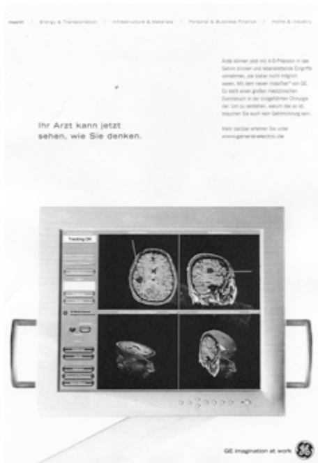
'Ihr Arzt kann jetzt sehen, wie Sie denken' (Anzeige im 'Spiegel' Nr. 13, 2004)