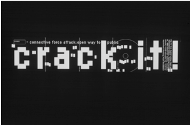
'crack it!', grafischer Entwurf/ Schriftzug. Knowbotic Research, xxxxxx connective force attack - open way to public, Hamburg 2000

sondern sich einer konkreten Profilierungsabsicht in einem benennbaren sozialen, dynamischen Feld verdankte. Der Künstler materialisierte seine Obsession als freier Wissenschaftler mittels einer Ingenieurleistung. Deshalb geht in jede Techno-Entwicklung ein, mit Ernst Bloch zu sprechen: Wärmestrom der Phantasie ein.